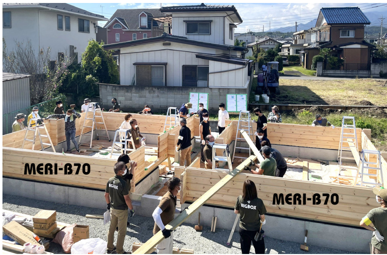
全景 セルフビルドスクールで「メリB70」と「メリB70」をセライジング