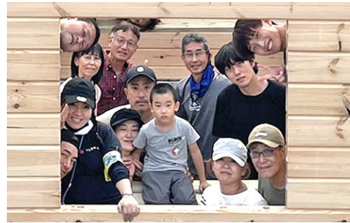
参加者の皆さんで記念にパチリ!!

群馬県渋川市にて、地域の住民たちのコミュニティとして、NPO法人様による「フードバンクしぶかわ」が誕生することになりました。会場では施主のご協力によりセルフビルドスクールを開催し、35名以上の方に参加していただきました。参加していただいた方は、老若男女問わずセルフビルド経験者、未経験者様々な立場の方がいらっしゃいましたが、チームワークを心がけ、笑顔の絶えない一日となりました。メリB70モデルを2棟建築するため、2つのチームに分かれて1段1段、安全第一で執り行いました。建築途中のポイントになる箇所やアドバイスの一つ一つ真剣に聞き取り、今後の自分達の経験のためにカメラで記録したりと真剣さも伝わり、非常に有意義な一日となり、多くの参加者の皆様も満足の表情でした。