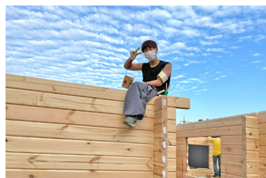
高所作業は気をつけて!!