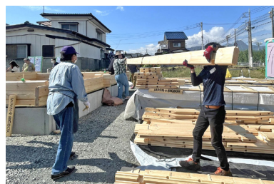
長ログを2人で運搬