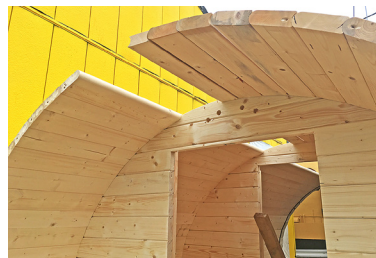
5 ガラスが入りましたら、同様に反対側のバレルの外壁を設置します。