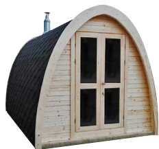
ESPOO エスポ 2.4 X 2.3m キャンペーンキット価格 1,288,000円(税別)