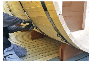
6 バレルの外側にステンレスのバンド5本を回し、内壁の位置にセットし、締め込みます。