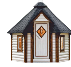
KUOPIO クオピオ 7m 2 (4.2J) キャンペーンキット価格 1,438,000円(税別)