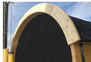
10 バレル(外壁)の前面と後面の上部に専用のアールのついたボードを設置します。