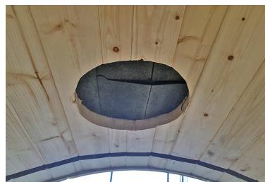
9 煙突が貫通する部分を丸くくり抜きます。