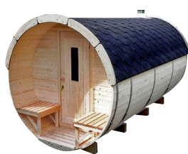
TURKU トルク 8.8m 2 (5.3J) Ø2.2 X 4 m キャンペーンキット価格 1,548,000円(税別)