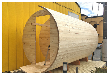
4 3枚の壁に沿ってバレルの材料を1枚ずつ設置して、外側からビス止めていきます。