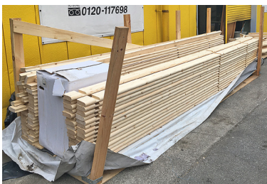
1 梱包を解きますとこんな感じで、材料が積んであります。