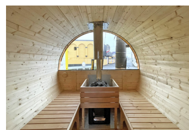
14 薪式サウナストーブと煙突を設置し、サウナストーン(キット内)をセットして完成。