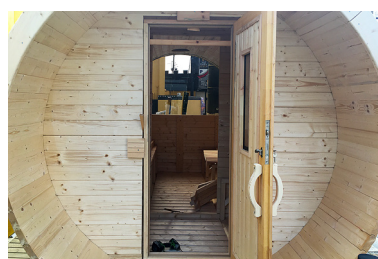
12 木製外部ドアを調整しながら設置します。