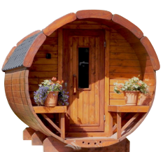
HELSINKI ヘルシンキ 4.8m 2 (2.9J) Ø1.9 X 2.5 m キャンペーンキット価格 1,088,000円(税別)