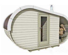
OULU オウル 10.3m 2 (6.2J) Ø2.4 X 4.3 m キャンペーンキット価格 1,418,000円(税別)