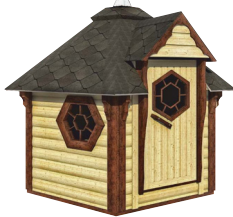
KOTKA コトカー 4.5m 2 (2.7J) キャンペーンキット価格 1,088,000円(税別)