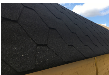
11 アスファルトルーフィングの上にアスファルトシングルを下から重ねて貼ります。