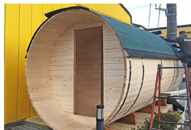
8 水切り用のアスファルトシングルに30mmほどかぶせてアスファルトルーフィング(キット外)を下から貼ります。