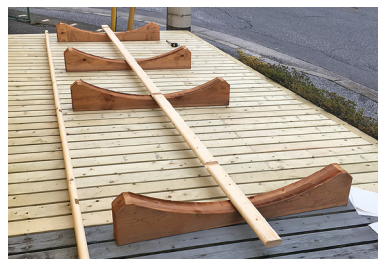
2 土台(キット内)をマニュアルの寸法通りに配置し、バレルの一番下に設置する外壁部材を内側からビス止めします。