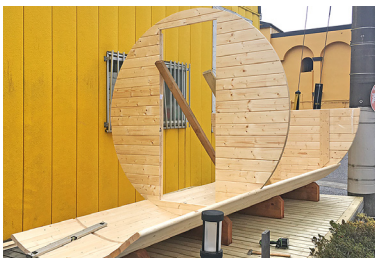
3 後ろの壁半分と中間の壁と全面の壁全部を立ち上げて、筋交いで仮固定します。