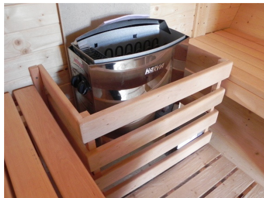
▲サウナストーブは外側が熱くなるので、困りがあった方がいい。周囲の壁も含め、自治体の火災予防条例などに適応した素材を使う(HARVIA社製/フィンランド)

一方の薪式ストーブは電気を 使わないので、どこでも設置で きる。薪に火をつけて室内が温 まるまでには少し時間がかか り、煙の匂いもあるので近所へ の配慮が必要な場合もある。し かし炎のゆらぎや醸し出す雰 気は格別で、根強い人気がある。 サウナストーンは主にフィ ンランドで採掘される天然の 香石が使用される。中でもカ ンラン石が長時間高温を維持 できるため、 ポピュラーに 使用されて いる。