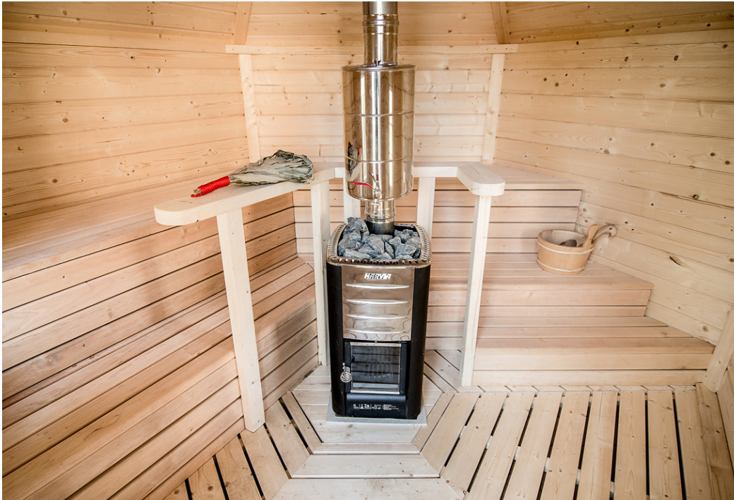
▲サウナは一般的に下段が70~80℃、上段が90℃ほどになる。高さの異なるベンチがあるといろいろな温度を楽しみやすい