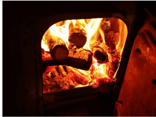
▲伝統的な薪ストーブは炎の跳めで心がやすらぐ。サウナからは電気式と薪式では蒸気の感触が異なるという声も