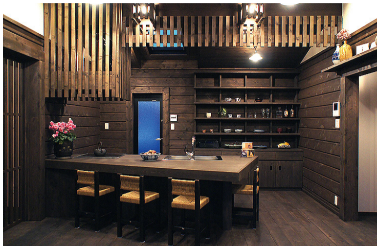
焦げ茶のログ壁と白の漆喰壁はコントラストの美しさとともに、調湿性にも優れています。