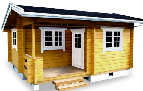
※外階段はキットに含まれません。