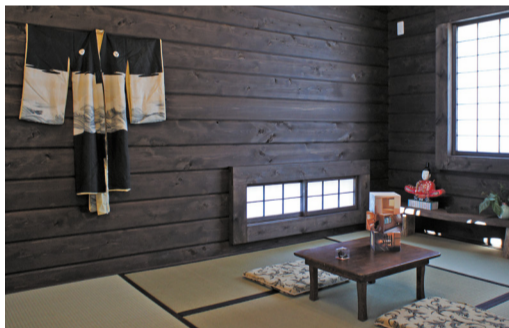
古き良き日本の伝統を継承した空間を再現しています。