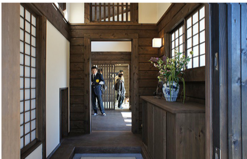
漆器壁と障子、格子が明るく開放的な玄関を演出しています。