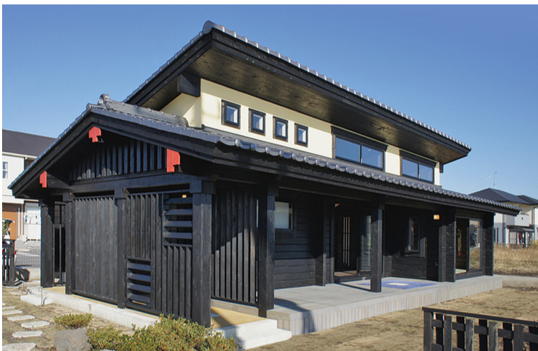
日本の郷愁、伝統の古民家をログハウスで再現しました。

●樹種とスタイルが合っているログハウス…熊野産のヒノキを使った、古民家風マシンカットの「八咫鳥(やたがらす)」モデル。プランは平屋。ログ材は黒く塗られ、木製のルーバーや漆喰壁、屋根の三州瓦といった和風のしつらえも相まって、年月を経た本物の古民家のような落ち着いた雰囲気をもっています。古民家ログハウスには、他に2階建ての「那智(なち)」、ロフトが付いている「熊野(くまの)」があります。ログハウスというと、どうしても輸入住宅というイメージが強いですが、実は日本には古くから丸太小屋(ログハウス)の伝統があったのをご存知ですか?正倉院の校倉造り(あぜくらづくり)、角材を組んだ構造の井籠倉(せいろうぐら)というものが有名です。古民家ログハウスシリーズは『ログハウス』×『古民家』×『国産材』をコンセプトに日本の伝統と現代の快適性を融合させた日本人のためのログハウスです。