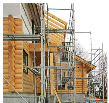
現場に訪れ気になったところ疑問に思ったことは、現場監督に聞くようす。

ビルダーと良い関係を築き気になることを相談している! いいログハウスを建てた人は、現場によく通い、現場スタッフと良い関係を築いていることが多いです。ビルダーも人間なので顔の見える相手のほうが力が入るといいます。建築時の棟梁や、現場監督がメンテナンスを担当することが多いので、関係を築くのは長い目で見て大切なことです。作業中の現場は施工に必要な釘や鋭利な工具が置いてあり、危険な場所でもあります。現場を訪れる際は、必ず事前に現場監督に連絡して安全確認をしてください。職人さんともコミュニケーションを深め、仕事を見ていただくことで家への愛着を深めていただきたいと思います。現場の作業や仕様など、疑問に思ったことは、躊躇せず聞いておきたいです。ただし、混乱を避けるため、質問は現場を取りまとめる現場監督にまとめて聞くようにしましょう。もちろん、常識的な礼儀も必要です。