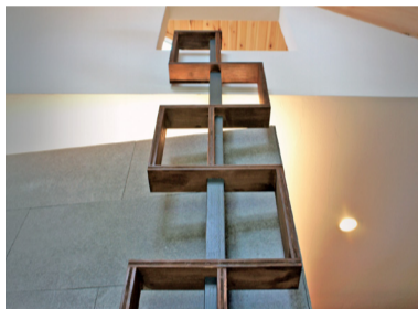
ロフトに上がる装飾階段はまさにアートオブジェ

【これはやめよう!】安さばかりに気を取られず、担当者との相性と材の品質をチェックしよう—ログハウスを安く建てることに集中しすぎるあまり、やっと思いながなが、面識のないメーカーへの突然の見積もり依頼です。弊社はメールや電話での突然の見積もりの場合は、具体的にどんなログハウスに暮らしたいのか、人なりもわかりませんから決まりきった内容でしか見積もりを出せませんし、まずはしっかりお話をさせて頂いています。楽しい家づくりを話しながらお客様に見合うプランをいくつかご提案します。安い高いで内容を精査することなく判断するのは危険ですので絶対にやめましょう。西欧では、家の寿命は100年といわれています。日本の家寿命はたった30年。その答えは資産価値の高い本物の家をつくれるかどうかにあります。その一要素がオリジナルのアイデアです。