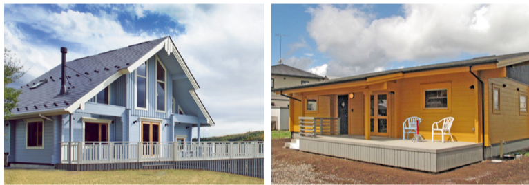
お客様のライフスタイルに合わせ様々なプランをご提供。大屋根プランや片流れプランなど!!