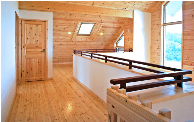
オリジナルのアイデアとしてデットスペースをセカンドリビングとして使用