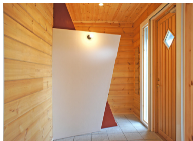
玄関のシューズクロゼット装飾壁がモダン