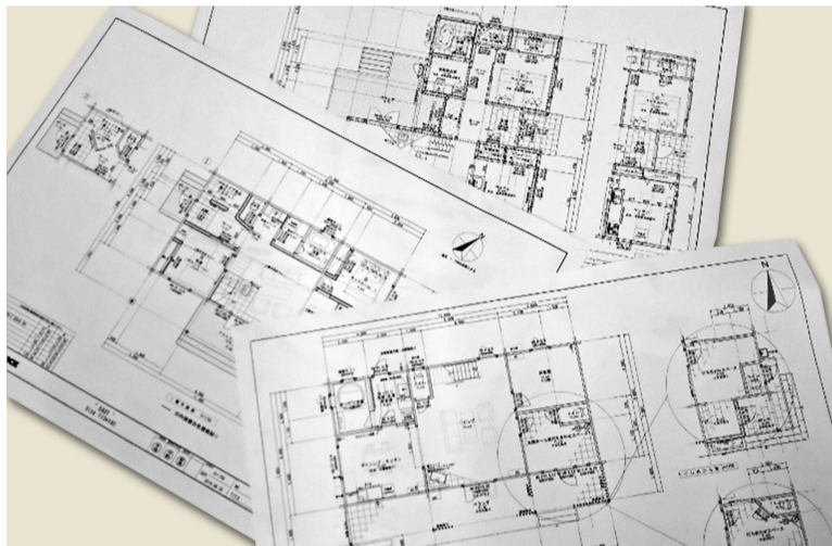
デザイナーより提案プランが何パターンも