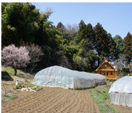
里山に建つログハウス

【これはやめよう!】安さばかりに気を取られず、担当者との相性と材の品質をチェックしよう—ログハウスを安く建てることに集中しすぎるあまり、やっと思いがちなのが、面識のないメーカーへの突然の見積もり依頼です。弊社はメールや電話での突然の見積もりの場合は、具体的にどんなログハウスに暮らしたいのか、人なりもわかりませんから決まりきった内容でしか見積もりを出せませんし、まずはしっかりお話しをさせて頂いています。楽しい家づくりを話しながらお客様に見合うプランをいくつかご提案します。安い高いで内容を精査することなく判断するのは危険ですので絶対にやめましょう。