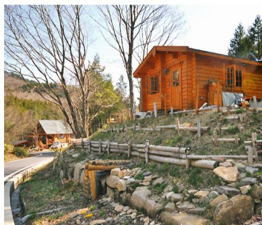
高台を有効に活用した暮らし