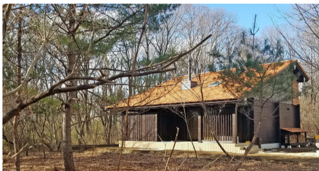
高原に建つ古民家ログハウスでの暮らし

土地選びからビックボックスに相談し一緒に現場を訪れてみる! 自然環境や医療、教育などの社会環境、交通の便まですべてに理想の条件が整った土地を見つけるのは難しいです。最高の立地だと思った土地に出会っても、即決せず、まずビックボックスに相談するといいです。その土地にログハウスを建てる場合、用途地域や建ぺい・容積率はもちろん、地区条件や建築協定などさまざまな事情が絡んできます。そういった建築にかかわることは不動産会社はすべて教えてくれるわけではありません。たとえば、格好いい大屋根のログハウスを希望しているのに、見つけた土地が建築物の高さを規制する斜線