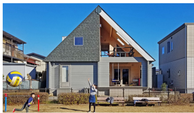
公園広場を借景として空間が広く感じる

規制がかかり理想どおりに建てられない場合があります。広い土地だからといって、理想のログハウスが建てられるとは限らないのです。土地探しの段階からビックボックスと一緒に検討して、現地の様子を見てもらえば、豊かな経験や専門的な知見からの確かなアドバイスももらえたり、不動産会社では得られない基礎的な調査を行ってくれます。ときには、ビックボックスからよりよい土地の情報がもらえることがあるかもしれませんので、ビックボックスと良好な関係を築き、要望を明確に伝え理解してもらうことが大切です。気に入った土地を見つけたら四季を通して何度か通うと、その土地の気候や地域住民との距離感など気づくことも多いです。