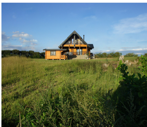
広々とした光景を楽しむ