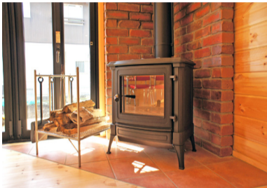
薪ストーブはネスターマーティン

完成した時は、自分も建築に携われたので達成感を感じました。内装を全面木貼りにして良かったです。仕事から帰って、家に入るとすぐに心地よい木の香りを感じます。木の家は、健康を害さないと聞いています。なるほど、落ち着くし、穏やかな気持ちになります。これから、子どもができたときのことを考えると、自然素材でできた住宅の方が安心できます。— [bbのワンポイントアドバイス] 今回はお客様の希望で全面木貼りですが、一部の壁を白壁にすることで、広く明るい屋内になります。ビックボックスでは、一部の壁にログ装飾壁を採用しています。