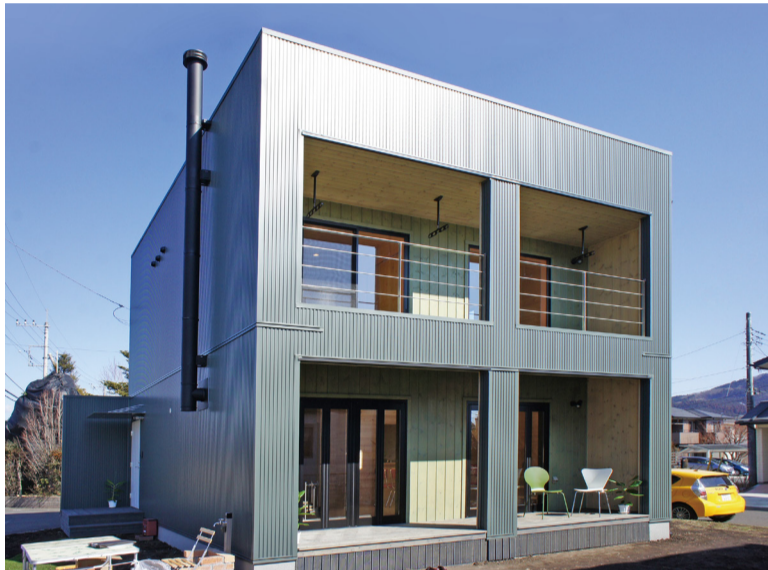
正面から見るガルバリウム質感がセンス良く光る。2階ベランダの手摺はオーナーさんの手作り