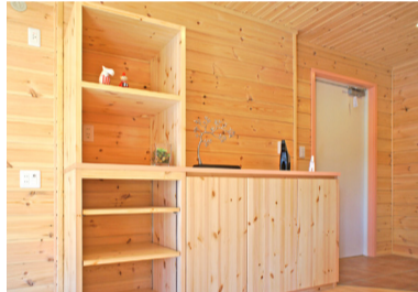
水槽を設置可能なbbオリジナルオーダー木製家具