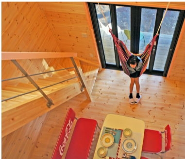
リビングを見下ろせる吹抜け空間にハンモックをつるす