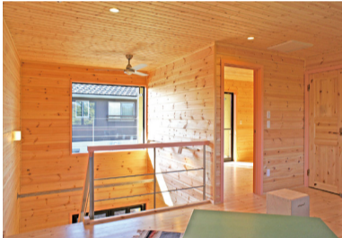
パインの香り漂う木質空間とスチール手摺