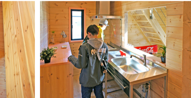
フレームタイプのステンレスキッチン間仕切りには開口