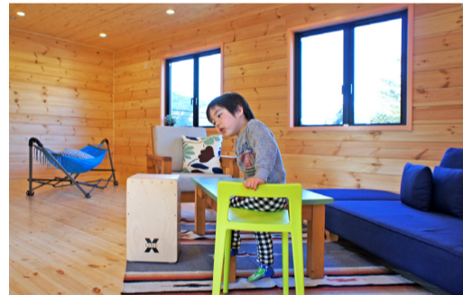
2階ロフトは自由な空間

完成した時は、自分も建築に携われたので達成感を感じました。内装を全面木貼りにして良かったです。仕事から帰って、家に入るとすぐに心地よい木の香りを感じます。木の家は、健康を害さないと聞いていますが、なるほど、落ち着くし、穏やかな気持ちになります。これから子どもができたときのことを考えると、自然素材でできた住宅の方が安心できます。