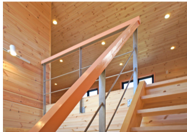
階段に木と鉄の融合のスチール手摺