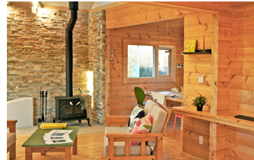
壁一面を石で貼りで重厚なナチュラル空間を生み出しています

型にはめて考えず自分 なりの設計にこだわる! 「かっこいいログハウス」をつくるうえで大切なのは、すべてにおいてその用途や目的を明確にすることです。このドーマーは何のために付けるのか、このドアはなぜ左開きでなければならぬのかといったことをはっきりさせれば、おのずと機能的に美しいデザインになります。そうした考えがなく「何でもいっや」とか「普通はこうだから」というふうになってしまうと、デザインにもまとまりがなくなってしまうと思います。お決まりの形になってしまっただけは、「かっこいいログハウス」はできないと思います。 ログ材と違う木や異素材を使ってアクセント! ログハウスは壁も天井も床も木でできているため、時には単調で味気ない雰囲気になってしまうことがあります。そういう場合には、質感や色が違う異素材を使うと変化がでます。代表的な異素材というとアイアンや石、タイルなど。例えば、グルニエ部分の手摺に重厚感があるアイアンを使ってアクセントにしたり、玄関や炉台に黒いタイルを使ってシャープな印象を与えたりします。木ばかりの空間の中に黒い色があると、空間が引き締まります。また、同じ木でも違う樹種を使って変化を出すと「かっこいいログハウス」ができます。