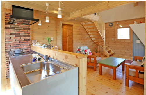
キッチンのサイドをアクセントとしてレンガタイルで仕上げました