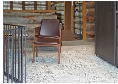
600角タイルやモダンパッチワークタイルを使用