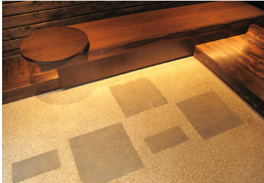
鉄平石を使用した玄関