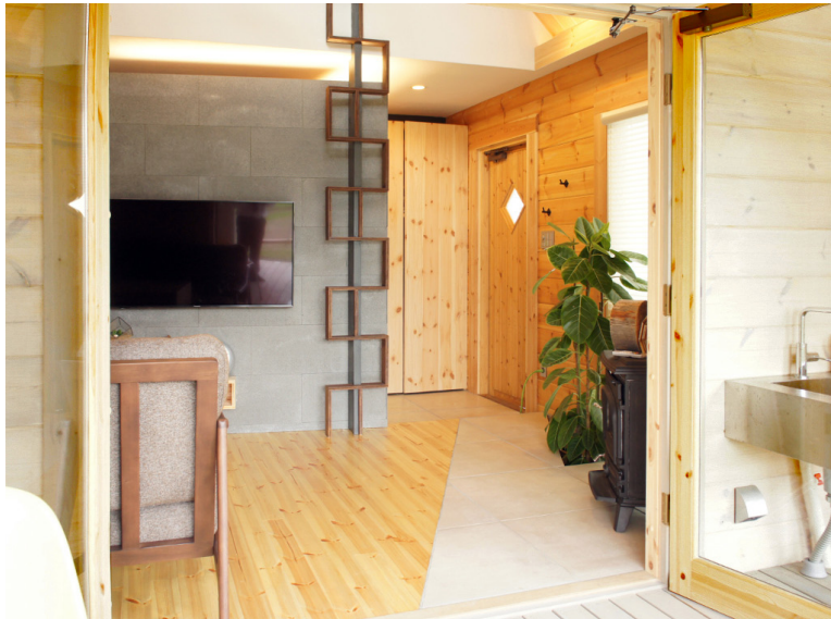
壁をセメント板貼り仕上げに間接照明でワンランク上の空間を演出しています。ハシゴも