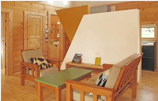
白壁のアクセントでログハウスをモダンに室内を明るくしています