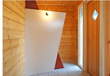
玄関の下駄箱用に目隠しのオブジェ。奥が下駄箱