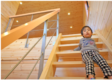
階段に木と鉄の融合の手摺をつけました

かっこいいログハウスの条件は人それぞれだし、ハンドカット、マシンカット、ポスト&ビームそれぞれでも変わってきます。しかし、共通しているのは、バランスが大切だということではないでしょうか。わかりやすい例を挙げると、極太のログ材を使っても、家が小さければアンバランスに見えてしまうし、部屋が広くても天井が低ければ圧迫感が出て見た目の印象も悪くなります。また、床の色が薄くて壁の色が濃ければ、色彩的に安定感を欠く部屋になってしまいます。こうしたサイズ感や色のバランスをうまくとるのはなかなか難しく、設計者やログビルダーのセンスが問われる部分になってきます。